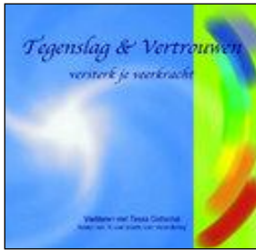
Cd 'Tegenslag & Vertrouwen'